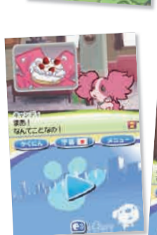
昔覚えていた英語を少しづつ思い出してきた