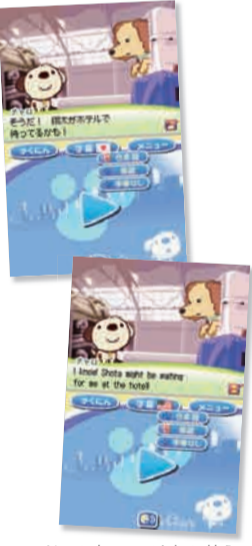
ゲーム中いつでも切り替え可能な字幕は日本語・英語。スキルアップしたら、字幕なしにも挑戦してみたい