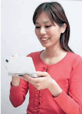
学生時代にカナダに留学経験のある奥さん「久しぶりに英語を思い出せそう」

任天堂 〈商品に関する問い合わせ〉 TEL0570-011-120 受付時間：午前9時～午後5時、土・日・祝除く http://www.nintendo.co.jp/charo/