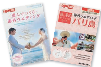
新プランが掲載されたパンフレットは、種類も豊富です

旅と挙式がセットになった「ルックJTB 海外ウエディング」のパンフレットには、4月からの新プランを掲載。中でも特にオススメのハワイ、グアム、バリでのウエディングについて、魅力を簡単に紹介しましょう。ほかのプランも、各支店の店頭でチェックしてね！