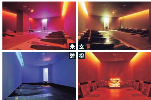
「朱・玄・碧・橙」の4タイプの岩盤浴室。目的に合わせて選んで※「朱」は女性専用