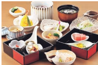
食事処では、地元の食材をふんだんに使った料理を堪能(イメージ)

※ 入浴料金・バスタオル・フェイスタオル・浴衣セット・施設利用料がパックになった割引セットの料金。午前3時以降は深夜料金別途 ※ 宿泊料金はツイン1泊(1室2人利用時、入館料・深夜料金含む)平日=1室1万1800円、土曜・休前日=1室1万4300円