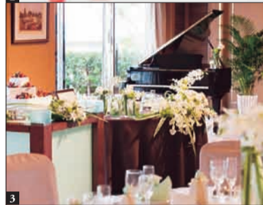
1 季節の花に彩られたチャペルとガーデン 2 美しいガーデンメニューは素材にもこだわりが 3 洗練と華やかさが同居するパーティー会場