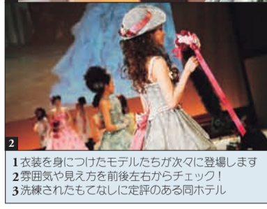
1 衣装を身につけたモデルたちが次々に登場します 2 雰囲気や見え方を前後左右からチェック! 3 洗練されたもてなしに定評のある同ホテル