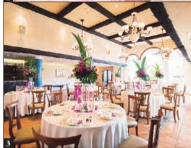
1 やわらかな陽光が2人を包む、セントチャペル。 2 海をテーマにしたブライズルームは、3タイプ 3 心が落ち着く、邸宅のようなレヴァンテ。