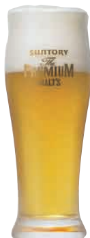
ザ・プレミアム・モルツ