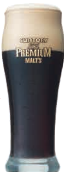
ザ・プレミアム・モルツ (黒)