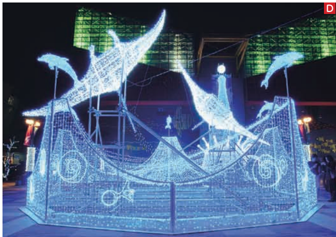
海遊館のシンボル、ダブルのジンベエザメが幻想的に浮かび上がる「アクアウエーブ」(写真A)。高さ約22mの巨大な「アクアツリー」。「幸せの鐘ゲート」をくぐる、ツリーのカラーが4色に変化。写真は「幸せのピンクツリー」と「ハッピーイルカショー」(写真B)。ゲストを出迎える巨大なカーテンをイメージした「アクアドレープ」(写真C)。初登場の「アクアクラウン」は、イトマキエイとマンタが海に羽ばたく様子をイルミネーションに(写真D)

オトクな「クリスマスペアチケット」発売中 12月25日(木)まで 海遊館&天保山大観覧車が 2人5400円→4300円に 期間中、毎日午後5時から利用できる、海遊館入館料&天保山大観覧車乗車料がセットになったペアチケットが、大人2人4300円(通常5400円)で登場。発売場所など、詳細はホームページ( http://www.kaiyukan.com/ )でチェックを。チケット購入者には、クリスマスポストカードのプレゼントもあります。