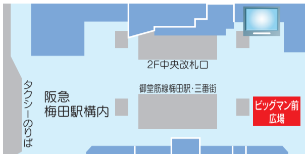
会場は、阪急「梅田」駅中央コンコース内の阪急梅田ビッグマン前広場

日時 10月31日(金)～11月2日(日) 午前11時～午後8時(最終日のみ午後7時まで) 会場 阪急梅田ビッグマン前広場(阪急「梅田」駅中央コンコース内)