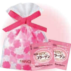
参加者にはこちらをプレゼント ※数に限りあり。なくなり次第終了

参加者には、オリジナル巾着袋入りの「HTCコラーゲン」2日分(12粒)と、小冊子「はずみキレイの法則」をプレゼント。