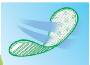
サラサーティ コットン100 表面シートは天然コットン100%。接着剤や防腐剤を使用せず、通気性も重視。56個入り・441円