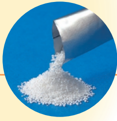
シトラス味の“苦くない顆粒”。 胃の中で有効成分がサッと溶け 出します