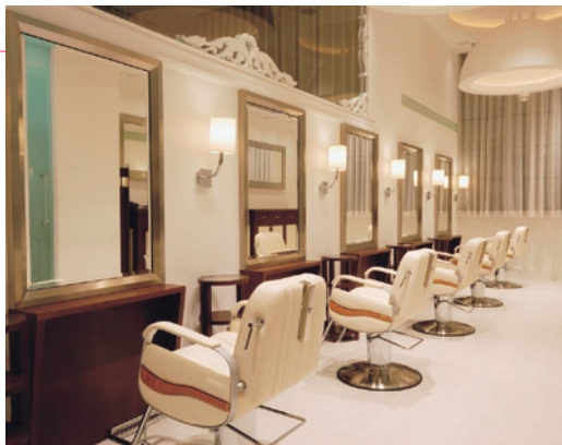
サロンエントランスに入れば、白を基調としたリラクゼーション空間へ

まつ毛カールは、まぶたにクリームを塗布して肌を保護し、液剤の前にはケラチンオイルを2度つけて、まつげをいたわります