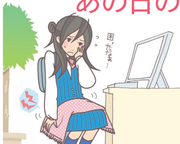
オフィスにいるときは特に困ってしまうデリケートゾーンのムズムズ感…。気にしないで仕事に集中したいよね

ブルーになりがちな生理中の快適さを追求するユニ・チャームの「ソフィ」シリーズに、「ソフィ はだおもい」が仲間入り！ 肌への張り付きによって感じる“かゆみ”に着目した新構造のヒミツを紹介します。