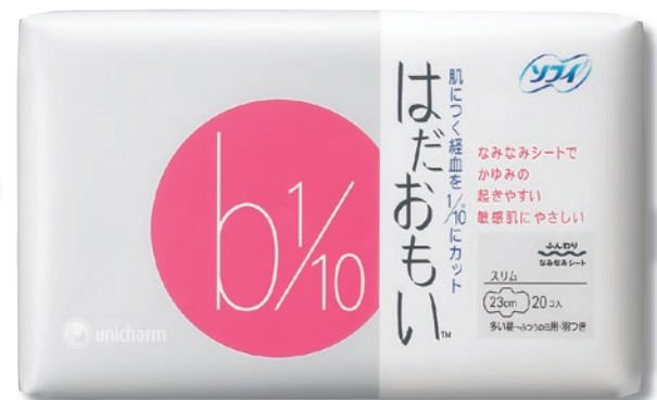
「ソフィ はだおもい」多い昼～ふつうの日用・羽つき(20枚入り)。医薬部外品

肌につく経血を10分の1(※)にカットし かゆみの起きやすい敏感肌にもやさしいナプキンに