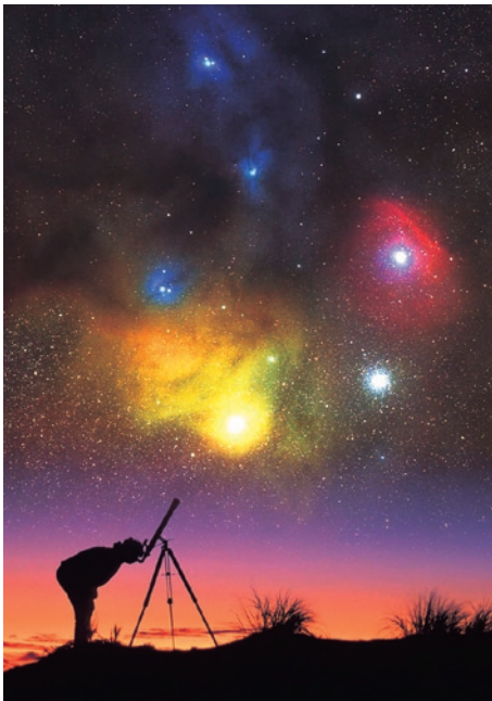
天体望遠鏡の先に広がる無限の星の数々…。そんな幻想的な世界を味わえるチャンスです (写真はイメージ)

輝く星空の下、都会の喧騒(けんそう)を忘れて、大切な人とステキな時間を過ごしてみませんか。