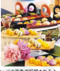
1 ガラス屋根に覆われたガーデンは、天気を気にしなくていいポイント。緑豊かなチャペル前ガーデンでのフラワーシャワーは、ヨーロッパの街角で祝福されるような、感動のシーンになりそう。チャペル「セント・アンナ」前の広場 2 自然光が降り注ぐ、明るい披露宴会場 3 つややかな和装姿も美しく映える 4 ブライダルフェアで披露宴の料理を試食して(イメージ) 5 デザートbuffetやファーストバイトなど、アットホームな演出を盛り込んで、二人の思い描く披露宴を実現しよう

うれしいフェア特典も 特典1 フェア当日仮予約をしたカップルにはウエディングメニュー試食会にペアで無料招待 特典2 8月31日(金)までに成約したカップルにはカラドレスのレンタル(20万円分)をプレゼント ※ほかの特典とは併用できません。