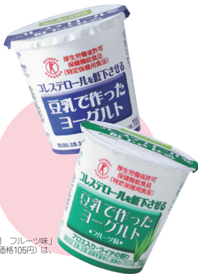
「豆乳で作ったヨーグルト」(同 フルーツ味) (各110g・メーカー希望小売価格105円)は、毎日2個を目安に

朝食やデザートとして、毎日取り入れたいのが、「豆乳で作ったヨーグルト」(※特定保健用食品)のもポイントです。 「おいしさスツキリ 調製豆乳」とともに、毎日のヘルシーな習慣にしてみませんか。最近、ベルトの穴を気にしているオフィスの サラリとしたクセの少ない豆乳に仕上がります。 また、主成分の大豆ンパク質に認められている、コレステロール低下の効果で(※参照)、同商品は厚生労働省から「特定保健用食品」の認定を受けています。 朝食用デザートとして、毎日取り入れたいのが、「豆乳で作ったヨーグルト」(※特定保健用食品)のもポイントです。 「おいしさスツキリ 調製豆乳」とともに、毎日のヘルシーな習慣にしてみませんか。最近、ベルトの穴を気にしているオフィスの