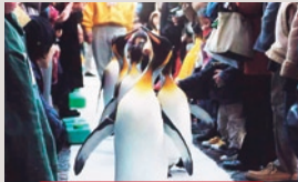
ペンギンパレード

12月25日までの毎日/太平洋水槽)午前10時50分～、午後1時15分～、3時50分～/タスマン海水槽)午前11時30分～、午後2時～