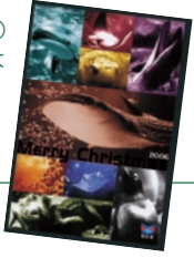
海遊館オリジナルクリスマスカード

発売期間 12月25日(月)まで 料金 4300円(大人2人・海遊館入館料+天保山大観覧車乗車料) 利用時間 海遊館午後5時～8時(最終入館は7時)、天保山大観覧車午後5時～10時(最終乗車は9時30分) 発売場所 海遊館チケットブース(午後5時～7時)、天保山大観覧車チケット窓口(午後5時～6時30分)