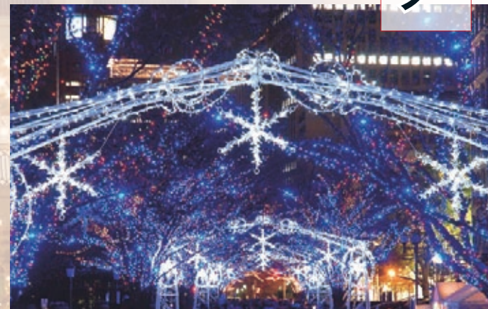
写真は昨年の様子

大阪市北区中之島一帯 OSAKA 光のルネサンス 2006 12月16日(土)～26日(火) 午後5時～11時 ※中之島イルミネーションストリートは、1日(金)～15日(金)は9時30分まで点灯のみ。16日(土)からショーを開催 実行委員会事務局 ☎06(6446)6855