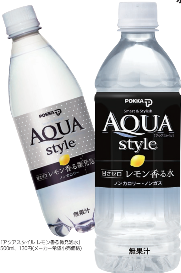
「アクアスタイル レモン香る微発泡水」 500ml、130円(メーカー希望小売価格)