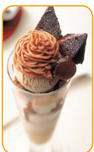
ほろ苦くて甘い「ビターズウィートモンブラン」900円

カフェ限定デザートも登場。ラインアップは、渋皮入りモンブランクリームを盛り付けた「ビターズウィートモンブラン」、スイートポテトのフディングとクリームをたっぷり味わえる「スイートポテトパフェ」、カスタードソースを敷き詰めたクレープでアイスクリームを包んだ「パナナクレープポテト」。早速食べに行かなくちゃ!