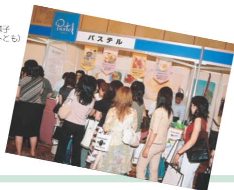
昨年の様子 (3カットとも)