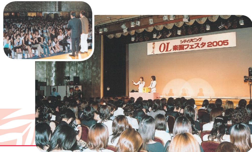
大勢のシティ読者が集まって、大盛り上がりでした (昨年の様子)