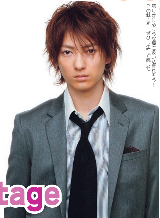
語りかけるような瞳に吸い込まれちゃうこの魅力。ぜひ、ご来場!

シティ読者が大集合して、毎年盛り上がりを見せる「シティリビング OL 楽園フェスタ」。9回目となる今年は7月27日(木)に、リーガロイヤルホテルで開催します。当日は、豪華なゲストを迎えるの lisäksi、大人気の芸能情報ショー、人気ある、盛り上がるコーナーもあり、盛り上がることも必至です。会社帰りに、友だちや同僚と一緒に参加してね。参加無料ですが、入場には招待券が必要。左下の応募用紙で申し込みを。