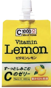
C1000 ビタミンレモンゼリー 180g 189円

ビタミンC1000mgをはじめ、4種類のビタミンとエネルギーが補給できるゼリータイプ。さっぱりとしたレモン味で、おいしく小腹を満たしてくれます