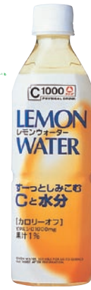
C1000 レモンウォーター 500mlPET 147円

ビタミンC1000mgと水分がカラダにスーッとしみこみます。すっきりとした後味のレモン味。カロリーオフなのうれしいね