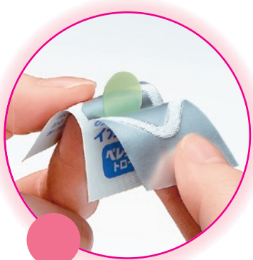
0.3mmのフィルムタイプ。しかも衛生的な個別包装

【ベレックス トローチ】(9個入り、医薬品) メーカー希望小売価格525円(税込み) 【効能・効果】のどの炎症によるのどの痛み、のどのはれ、のどのあれ、のどの不快感、声がれ、口腔内の殺菌・消毒、口臭の除去 【用法・用量】服用量は1回1個、15歳以上は1日4~6回が目安です。トローチ剤なので、かんだり、そのまま飲み込んだりしないこと 【使用上の注意】※本剤を使用している間は、抗ヒスタミン剤を含有する内服薬(かぜ薬、鎮咳去痰薬、鼻炎用内服薬、薬酔い薬、アレルギー用薬)は服用しないこと