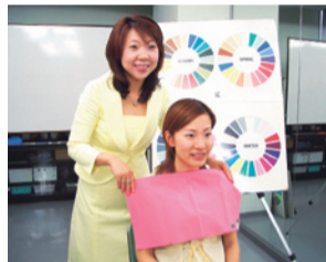
パーソナルカラー体験で、自分に合った色を見つけて(イメージ)

体験レッスン以外にも、ライブやウォーキング、演奏会などのステイション、展示ブース、PRブースが日替わりでお目見えします。協賛スクールのパンフレットや作品の展示もあるの で、体験レッスンに参加できない人も注目してみてください。期間中、会場となっているロトナタ時計台前広場の「B.S.M.C.L.U.B.」(年費・入会金無料)に登録すると、来店するだけでポイントが加算されるほか、各ショップでの割引特典や会員限定の優待セール、映画試写会への招待など、さまざまな特典が受けられます。 会員登録は、go@bmsmclub.jpにメールを送って、賢くショッピングしたい人へは、こちらです。休日は、いろいろなお楽しみが満載の岸和田カンカンベイサイドモールへお出かけください！