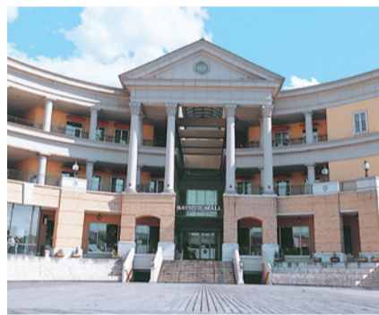
シーサイドにたまたずオシャレな洋館風の建物がステキ

ファッションやインテリア、雑貨などのアウトレッシュショップをはじめ、グルメ、映画館「ユナイテッド・シネマ岸和田」、アミューズメント施設が揃う「岸和田カンカンベイサイドモール」。シーサイドのロケーションに建つ洋館風の建物がオシャレな同モールは、ショッピングに、アミューズメントにと、欲張りに一日中楽しめます。9月には6周年を迎え、ますます充実の「注目したいスポット」です。 同モールでは、9月23日(祝・金)～10月16日(日)に、6周年を記念して多彩なアニバーサリーイベントが開催されます。アニバーサリー記念セールや、雑誌などのアウトレッシュショップをはじめ、グルメ、映画館「ユナイテッド・シネマ岸和田」、アミューズメント施設が揃う「岸和田カンカンベイサイドモール」。シーサイドのロケーションに建つ洋館風の建物がオシャレな同モールは、ショッピングに、アミューズメントにと、欲張りに一日中楽しめます。9月には6周年を迎え、ますます充実の「注目したいスポット」です。 同モールでは、9月23日(祝・金)～10月16日(日)に、6周年を記念して多彩なアニバーサリーイベントが開催されます。アニバーサリー記念セールや、雑誌などのアウトレッシュショップをはじめ、グルメ、映画館「ユナイテッド・シネマ岸和田」、アミューズメント施設が揃う「岸和田カンカンベイサイドモール」。シーサイドのロケーションに建つ洋館風の建物がオシャレな同モールは、ショッピングに、アミューズメントにと、欲張りに一日中楽しめます。9月には6周年を迎え、ますます充実の「注目したいスポット」です。