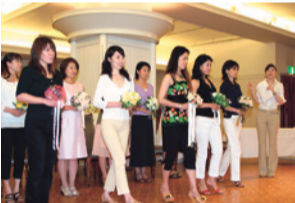
セレブ気分歩き方のレッスンを(イメージ)