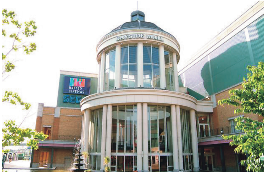
開放的なロトナタ時計台前広場でレッスンを体験

ショッピングやグルメなど、あなたスタイルの楽しみ方ができる「岸和田カンカンベイサイドモール」では、6周年を記念して、岸和田カンカンベイサイドモール6周年記念特別企画「センスアップ・フェスティバル」を開催します。多彩なイベントがたくさん用意されているので、新しいことにチャレンジしてみたい人、トレンドに敏感な人、足を運んでみませんか？