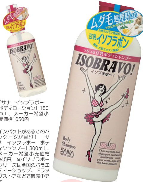
「サナ イソブラボー ボディローション」150ml、メーカー希望小売価格1050円

夏はすぐそこ! 全身のお手入れに気を抜けないこれからの季節に向けて、今からボディメンテナンスを始めませんか? そこで注目したいのが、新発想のボディケア「サナ イソブラボー」と、ドリンク「ビューパワー メリロート」。スキのない夏美人を目指してシティ読者が早速試してみたよ。