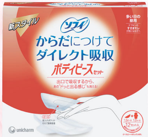
「ソフィ ボディピースセット」12セット入り600円。医薬部外品。6セット入り365円もあります※価格はメーカー希望小売価格(税別)