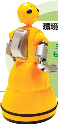
ロボットアテンダントのWakamaru