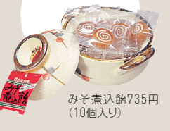
みそ煮込鍋735円（10個入り）

ウケ狙いにはこれが一番。名古屋駅やテレビ塔などで販売。問い合わせ/名古屋テレビ塔 ☎052（971）8546