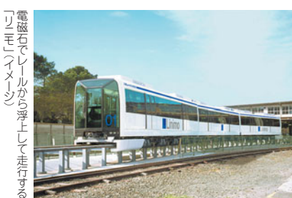
電磁石でレールから浮上して走行する「リニモ」（イメージ）

会場アクセスや会場内移動にも、近未来を感じさせる乗り物も。まずは、藤が丘駅から長久手会場を經由し、万博八草駅を結ぶ、東部丘陵線「リニモ」。国内で初めて実用化される、リニアモーターカーとあつて、鉄道ファンならずとも、要チェックです。また、低公害バスが軌道上を自動運転で走行する、新交通システム「MITS」も、燃料電池ハイブリッドバスなど、環境にやさしい乗り物が登場。未来を先取りした乗り物の数々、この機会に体験してみてください。