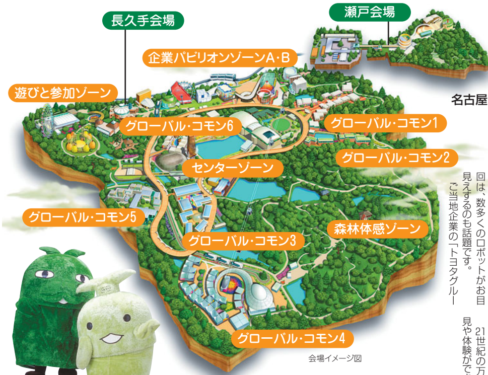
公式マスコットキャラクターの「モリゾー」（左）と「キッコロ」（右）