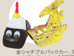
金シャチフルバックカー、天むすフルバックカー各500円

キラキラのシャチホコと、目がキュートな天むすのおもちや。問い合わせ/名古屋テレビ塔 ☎052（971）8546