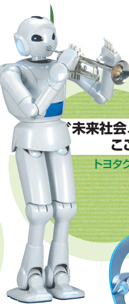
担当するウエルカムショー。楽器演奏ロボットたちの細やかな動きに注目（左）。未来コンセプトビークル「iUnit」（右）

近未来的な車や、最新技術を駆使したロボットがそろったパビリオン「トヨタグループ館」。私たちが、子どものころ思い描いた未来の世界を、たっぷり味わえそう