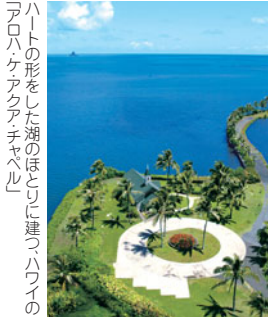
ハートの形をした湖のほとりに建つ「ハワイのトロピカルリゾートホテル」

当日の来場者には、もちろん「憧れの地で、マイ・スタイル・ウエディング」のトレンドをキャッチし、大阪コンタクトセンターか、近くの近畿日本ツーリスト店頭へ、ホームページからも予約できます。