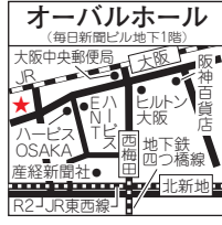
オーバルホール(毎日新聞ビル地下1階) 大阪中央駅 毎日新聞ビル ハービス OSAKA 産経新聞社 R2 京東西線