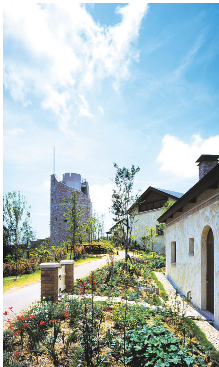
四季折々の草花を楽しむことができる「六甲ガーデンテラス」には、飲食店や雑貨店も