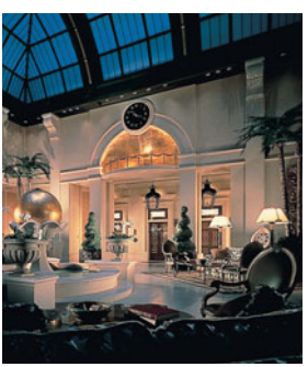
噴水もある25階のアトリウムロビーは、撮影にぴったり