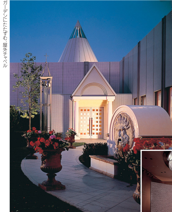
ガーデンにたすむ、屋外チャペル

期間限定のプランには、ホテル阪急インターナショナルならではの、うれしいギフト、が盛りだくさん。プランには、フランス料理フルコースやテーブル装花セット、音響・照明なども含まれている。とてもオトクな内容だから、チェックして！ 2005年1月1日(祝・土)～31日(月) 40人・98万円 ※1人追加料金1万9500円(税・サ込み) プラン特典(一例) ●来賓、新郎新婦の入場を、女性デュオまたはパイオリンとフルートの生演奏で演出する「ウェルカムクラシックライブ」のプレゼント ●贈呈用花束プレゼント(2点) ●披露宴当日、新郎新婦をスイートルームへ1泊招待 ●結婚1周年記念として、新郎新婦を食事に招待 ※2005年2月・3月限定「SPRING PLAN」40人・100万円(1人追加料金2万円、税・サ込み)もスタンバイ。10月1日(金)受け付け開始。