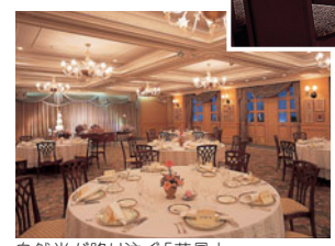
自然光が降り注ぐ「花風」は、邸宅のような雰囲気