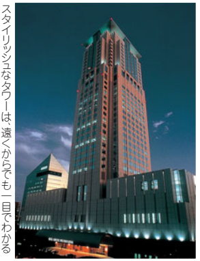
スタイリッシュなタワーは、遠くからでも一目でわかる