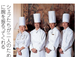
シェフたちが一人のために腕を振るってくれる