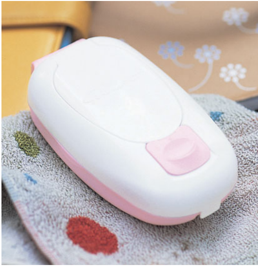
「シルコットウエットティッシュ プチパクト」は大きさがかわいくて、カバンに入れて持ち運ぶのにピッタリ