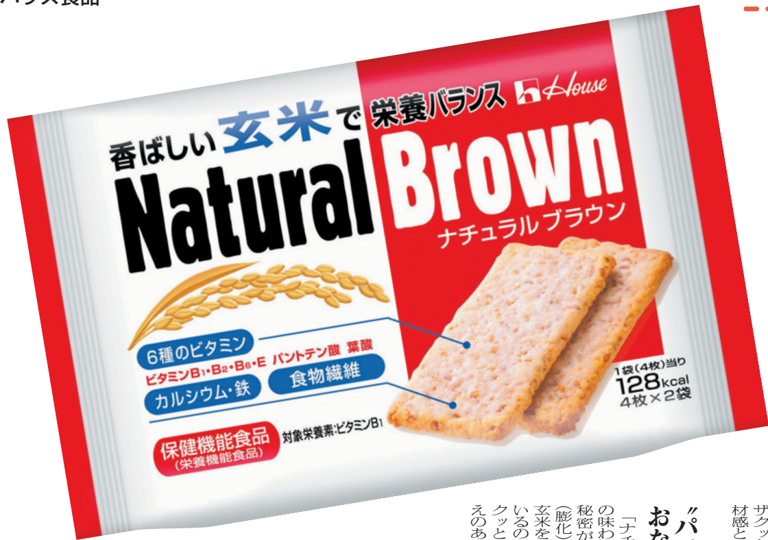
「ハウス ナチュラルブラウン」4枚入り×2袋 メーカー希望小売価格 150円(税込み)