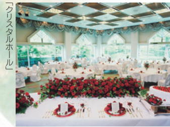
クリスタルホール

もちろん「パオーレ」の、なほ、ブライダルフェスティバルの予約は不要で、さまざま会場をしっかりと。当日は、1階の総合受付へ。その日に、ブライダルサロンで個別相談をしたゲストルーム「サンシャインテラス」や、「クリスタルホール」をはじめとする、多彩なパンケットなど、当日はブライダルフェスティバルでコーディネートされた、各会場の展示もチェックできます。