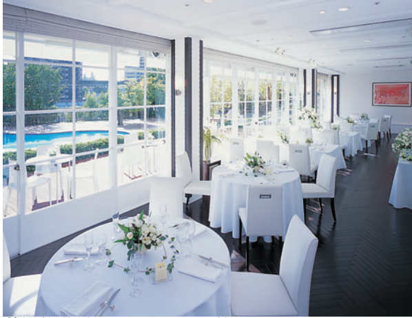
30人ほどの披露宴には、インテリアのセンスが光るゲストルーム「サンシャインテラス」も評判

これを記念して、11日(日)にはブライダルフェスティバルを開催。ブライダル全般の相談はもちろん、スタイリストによるヘアメイクや、プロのカサマンによる無料撮影がうれしい。「ドレス試着会&フォトシューティング」は、一人ひとりにぴったりのベストカラーを見つける「パーソナルカラー診断」など、楽しい企画もいっぱい。