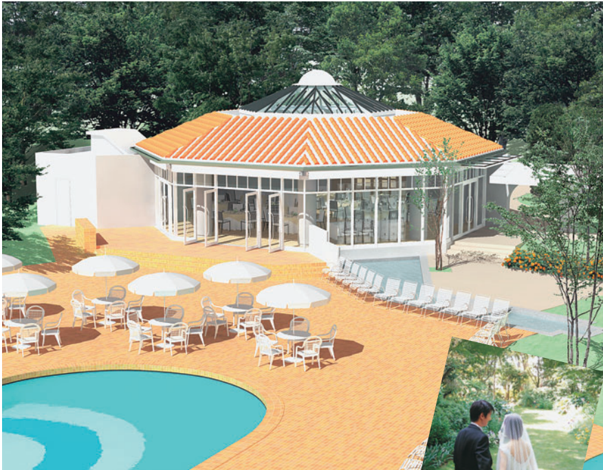
おしゃれなウエディングなら、ウイラ感覚の「パオーレ」で。リゾート気分いっぱいのプールサイドで、一生の思い出となるパーティーを(完成イメージ)

これを記念して、11日(日)にはブライダルフェスティバルを開催。ブライダル全般の相談はもちろん、スタイリストによるヘアメイクや、プロのカサマンによる無料撮影がうれしい。「ドレス試着会&フォトシューティング」は、一人ひとりにぴったりのベストカラーを見つける「パーソナルカラー診断」など、楽しい企画もいっぱい。