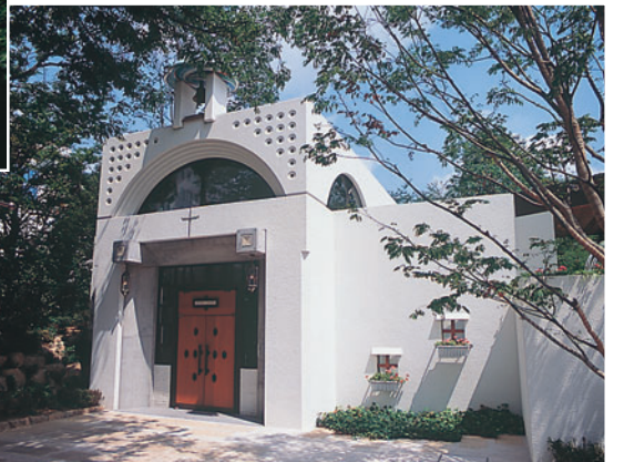
クリスタルの十字架や大理石のパーシロードが出迎える「クリスタルチャペル」