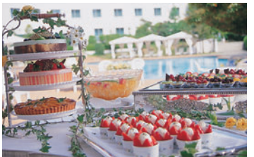
パーティーの締めくくりは、「デザートビュッフェ」。パティシエの作り出す美しいデザートをお好きなだけいただくのが、人気のスタイル

ガラス張り開放感あふれる、新ウエディングスポットがお目見え 自分らしい結婚式のスタイルを追求するなら、レス・トランウエディングのようなプライベート気分を満喫できる。千里阪急ホテルのリゾートウイラ「パオーレ」は、一面ガラス張り。美しいカーテンをのぞむ南仏風の「パオーレ」が7月9日(金)装いを新たにリニューアルオープンします。