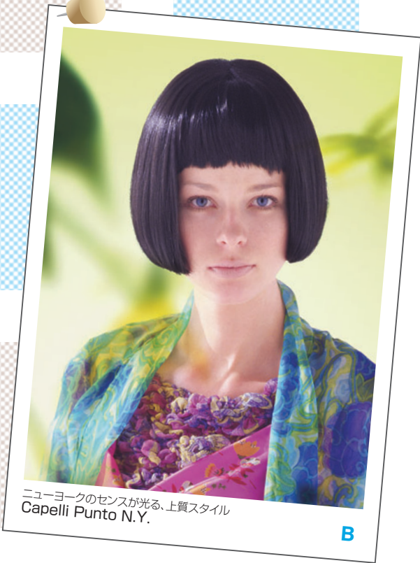
ニューヨークのセンスが光る、上質スタイル Capelli Punto N.Y.