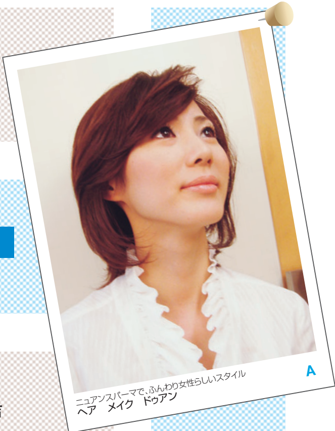
ニュアンスパーマで、ふんわり女性らしいスタイル ヘアメイクドゥアン