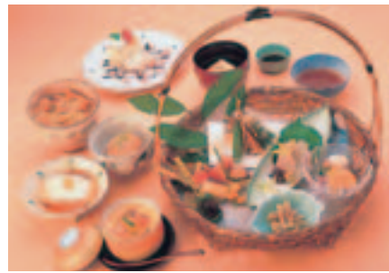
天然ラジウム温泉 太山寺 なでこの湯 ☎078(977)0261

神戸から約30分で行ける「天然ラジウム温泉 太山寺 なでこの湯」。おすすめのレディースプラン「休日の隠れ家」。4500円(税別)は、地元の素材をふんだんに使った料理「しょうじん風なでこ」に、温泉入浴(タオル・バスタオル付き)、作務衣貸し出し、コーヒーサービス、地下鉄学園都市駅までの送迎付き。忙しいこの時期、しばしリフレッシュを!