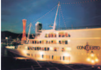
ミュージック・グルメ船 コンチェルト ☎078(360)5600

海の上でロマンチックな聖夜を。ミュージック・グルメ船「コンチェルト」では、12月20日(土)～25日(木)、クリスマスクルーズを開催。R&B、JAZZ、アカペラなど日替わりの音楽を楽しみながら、優雅にディナーを(写真はイメージ)。中華バイキング1万3000円、中華コース1万8000円～、鉄板焼コース2万円。乗船料・税込み。カウントダウン、新春クルーズなど年末年始はイベント盛りだくさん。