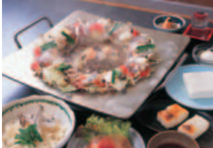
但馬牛専門店 炊肉料理 たきにく亭 ☎06(6426)6367

上質の但馬牛とたっぷりの野菜を、中央がくぼんだ鉄板で炊くのが「炊き肉(たきにく)」。特製ダレとの相性も絶妙。うまみたっぷりのシメのおじやまで、初めて出合うおいしさを楽しんで。セット2000円～、コース4000円～、牛刺し・焼きガニ付きの5000円コースはお値打ち。飲み放題も用意。心齋橋店(ジ・アトリウムビル3階)☎06-6243-6005も。税別。